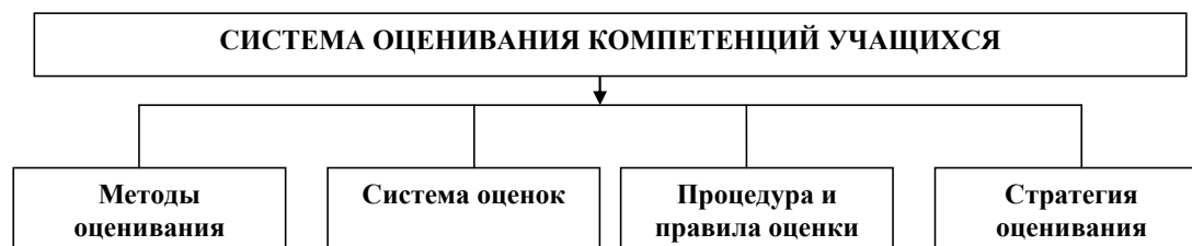
Рис. 2. «Составляющие системы оценки ключевых компетенций учащихся школы»

Система контроля предполагает наличие системы оценки, с помощью которой осуществляется проверка соответствия знаний, умений и навыков предъявляемым к ним требованиям, т.е. контроль. В компетентно-ориентированном подходе результативность учебного занятия определяется продуктом, результатом активной деятельности учащихся по освоению компетенций и личностных качеств.